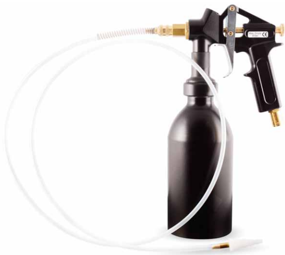
J02250 | JLM Diesel DPF Cleaning Toolkit (Reinigungsgerät)