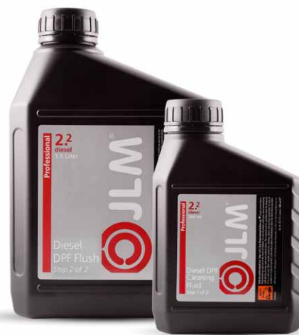
J02230 JLM Diesel DPF Cleaning & Flush-Flüssigkeitsset