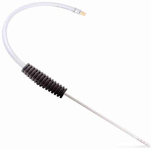
J02256 | JLM Diesel DPF Probe (Langdüse)

Anmerkung zu 4. Falls eine leicht zugängliche Sensorbohrung vorhanden ist, von der sich die Reinigungsflüssigkeit direkt auf den Filter (Monolith) aufsprühen lässt, kann die Langdüse JLM Diesel DPF Probe (J02256) für direkte Reinigung eingesetzt werden. In diesem Fall kann die Bohrung des vorderen Temperatur- oder Drucksensors des Filters verwendet werden, um die Reinigungsflüssigkeit direkt auf den Monolithen aufzusprühen. Die Langdüse beim Einspritzen bewegen, um die gesamte Filterfläche zu behandeln.